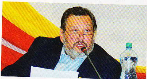
Starosta Prahy 5 Milan Jančík

Tajnou dohodu v roce 2006, která pomohla Jančíkovi uchopit pevně moc do svých rukou, podepsali i někteří členové ODS, kteří proti Jančíkovi vystupovali, například poslanec František Laudát, nyní šéf pražské TOP 09.